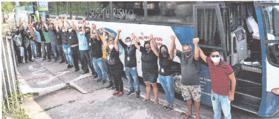
Agentes de viagens, guias, motoristas e representantes de agências de turismo se concentraram ontem pela manhã no Tirirical, de onde saíram para um buzinaço