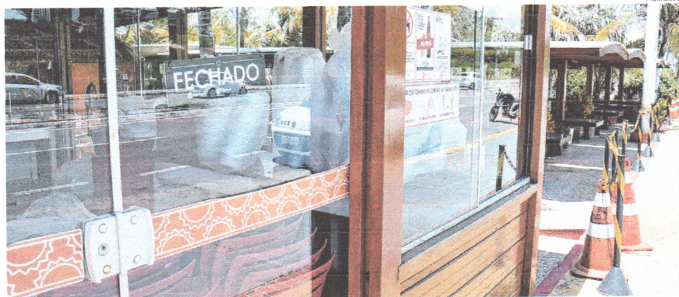
Setor de bares e restaurantes, que atualmente está atendendo somente por delivery, reivindica que seja retomado serviço presencial interno, seguindo as normas sanitárias

Segmentos de turismo, bares e restaurantes e de serviço de transporte por aplicativo estão sofrendo os efeitos da crise provocada pela pandemia da Covid-19. POLÍTICA 3 E CIDADES 6