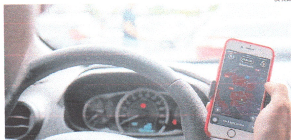
Motoristas por aplicativo estão desistindo da atividade por causa das crises sanitária e financeira

Com menos pessoas circulando na capital maranhense, viagens diminuíram, assim como o faturamento; situação que piorou com aumentos do preço de combustíveis. CIDADES 6